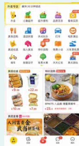
美團 APP 版面。一個 APP 就能滿足生活出行各種需求，超方便！