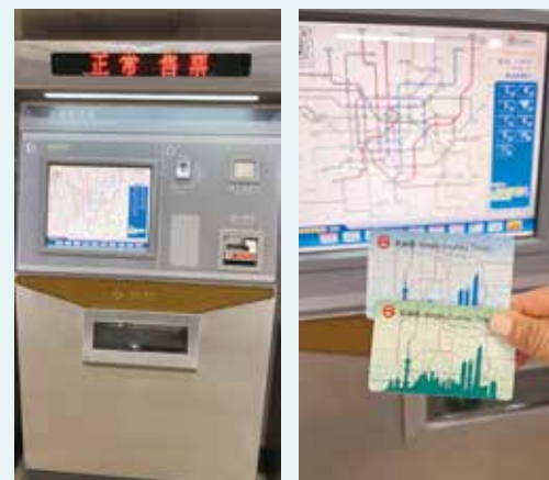
地鐵車票可以透過自動售票機購買。乘客也可以前往站內的服務中心購買公共交通卡出行。

目前，上海地鐵有 21 條運營路線，大部分地鐵路線服務時間由早上 5:00 到晚上 10:30 左右。上海地鐵實行按乘坐里程計費的分段票價制：0~6 公里 RMB 3，6 公里之後每 10 公里增加 RMB1（除磁浮線和金山鐵路），一般車費一趟約 RMB3~5。