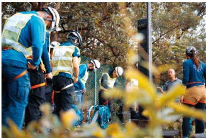
■ 男女隊員接受一樣標準的體能測試。