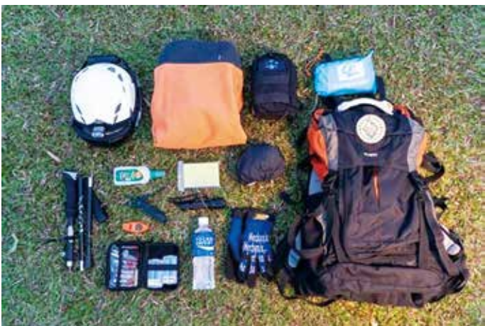
■ 登山裝備缺一不可。