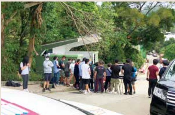
■ 這次失蹤事件引來媒體廣泛報道。

在二〇二一年四月廿二日，VMST (Voluntary Mount Search Team，自立民間搜索隊) 正式成立。會徽由飛鵝山山形、火炬、指南針和定位組成，象徵着團隊希望在山中為失蹤者引導方向。