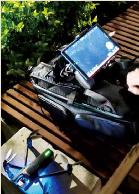
■部分自發搜索人士操縱無人機，以航拍方法輔助搜尋。

十六至十七日這兩天，好些自發搜索的市民都往飛鵝山一號集合，高峰期有數十名市民參與，大家圍在一起討論路線和資訊。雖然沒有「大台」組織，但大家各自都帶備了有用的器材，並擔當起不同的角色和崗位：當時每四至五位市民組成一組，輪流上山搜索。上山前，大家都有默契地先互相「對頻」，確認對講機頻道正確；在山上，當發現疑似失蹤者物件時，即馬上和地面通訊員聯絡，由通訊員和家屬溝通，確認物件是否屬於失蹤者。