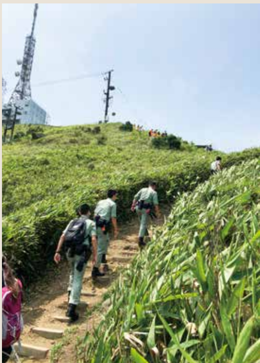
■ 紀律部隊出動，上山搜尋失蹤者。

最終，經過連日搜索之後，在四月十八日下午約四時，消防及民安隊在飛鵝山自殺崖一處險峻山崖縫隙尋獲失蹤者遺體，約兩小時後由直升機吊走。