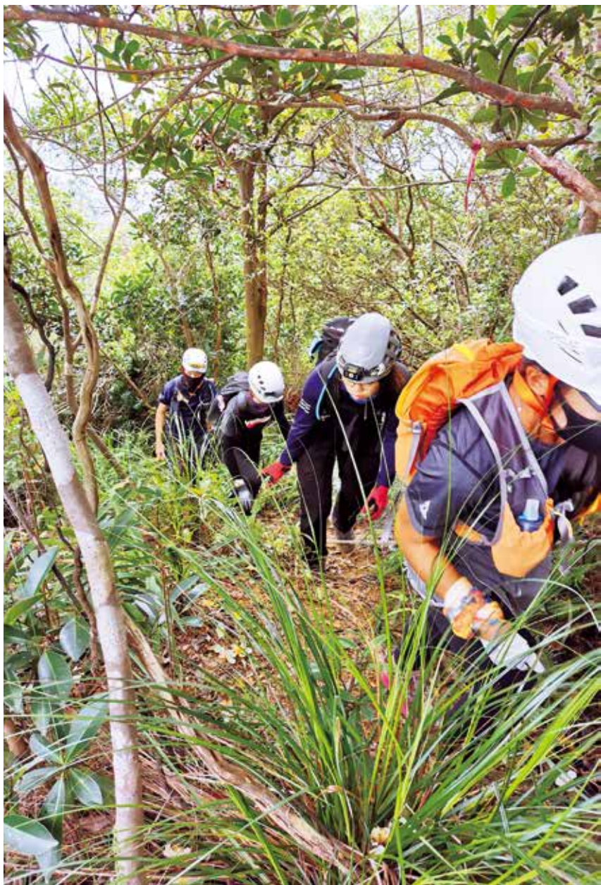
■ VMSI 每次都是抱着「堅持才看到希望」的信念搜索失蹤者。

而且，我們很想向家屬傳達一個訊息，除了你之外，社會上還有人關心和緊張你不知所蹤的親人，這是一份心意。