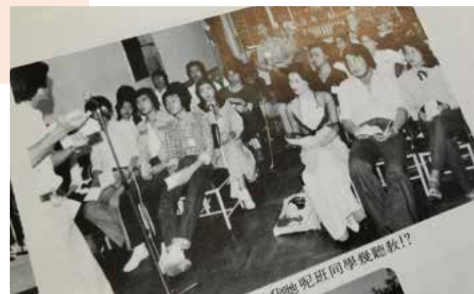
上課時大家都很留心。（摘自《畢業綜合晚會》場刊）