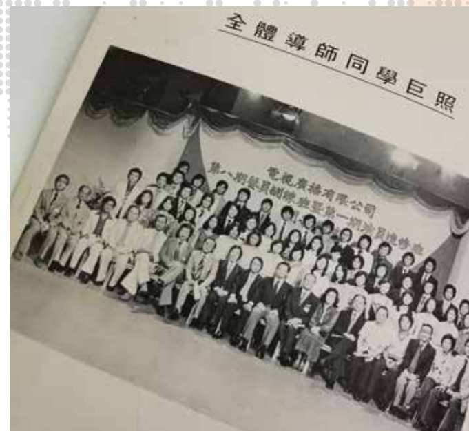
第八期藝員訓練班開學典禮。

當年的藝員訓練班，課程不像後來在將軍澳時代那麼規範。當時的課程規模未算太完善，所謂的訓練都是邊做邊學，我們有機會在幕前幕後不同崗位實習，當中包括拍劇和配音。