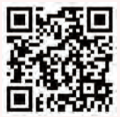
For iPhone (iOS)