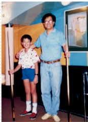
◎ 小時候我與爸爸的親子活動，就是打桌球。

勤力，總會有回報。十一歲，我幾乎每次都能打三至四十度，十二歲時的一桿最高度數（highest break）約六十度左右。即使那時算是打得有板有眼，但我還是很討厭於眾目睽睽下打波，生怕被取笑。我最怕就是偶意打出好球，周圍的人即嘩聲四起，所以我一定躲在房裡打。若發現有人偷看，我會即時罷打，算有性格吧？問題來了。