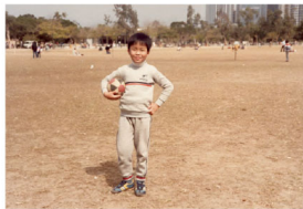
◎小時候熱愛《足球小將》，更夢想成為職業足球員。