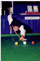
◎ 於加拿大參加桌球賽事時，我們都必須穿著恤衫、背心並打煲吹正裝上陣。